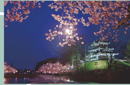
高田城址公園観桜会 約4000本のソメイヨシノが咲き誇り日本三大夜桜で海外のニュースでも取り上げられた観桜会 Takada castle site park Cherry Blossom Festival The Castle grounds contain over 4000 cherry blossom trees. It is widely considered to be one of the top three locations in Japan for viewing illuminated cherry blossoms during the spring.