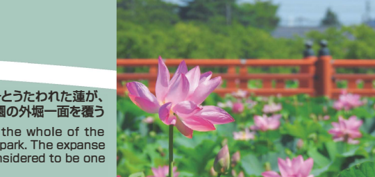
高田城址公園観蓮会東洋一とうたわれた蓮が、高田城址公園の外堀一面を覆う Lotus flowers cover the whole of the outer moat of Takada park. The expanse of lotus flowers is considered to be one of the biggest in Asia.

加盟店商品は上越妙高駅内さくら百喜店内でも販売中ですが、クーポンのご利用は出来ません。